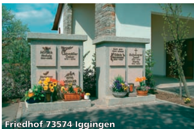
Friedhof 73574 Iggingen