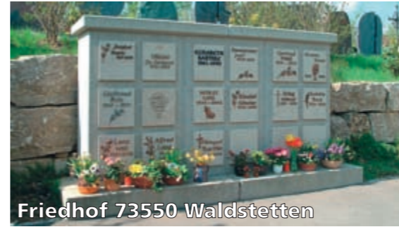
Friedhof 73550 Waldstetten