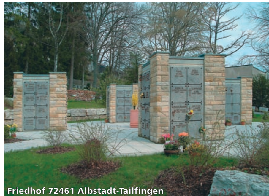
Friedhof 72461 Albstadt-Tailfingen