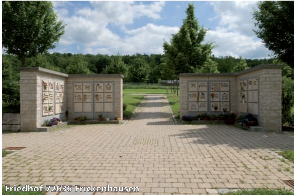
Friedhof 72636 Frickenhausen