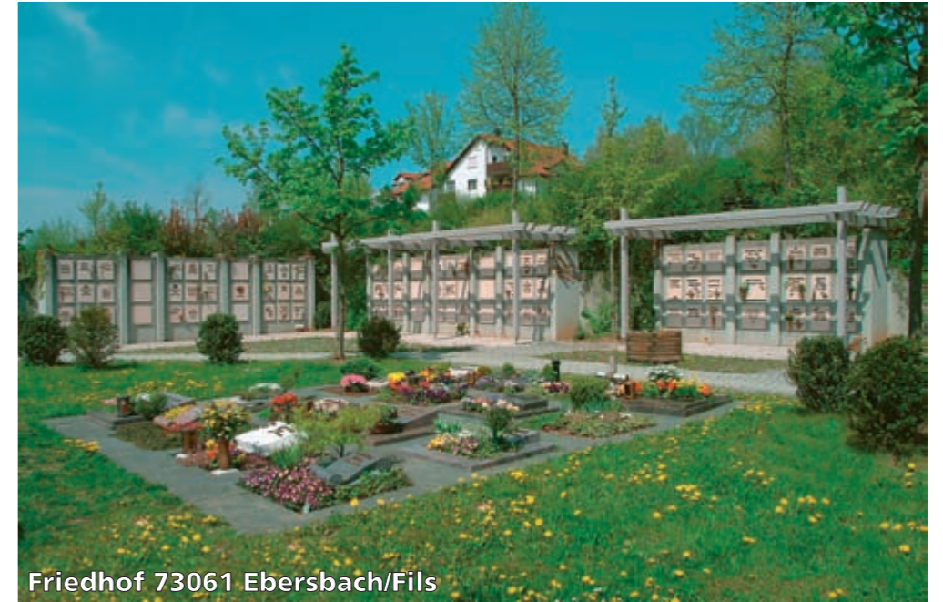
Friedhof 73061 Ebersbach/Fils