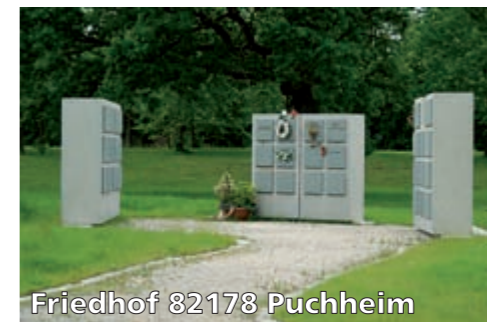
Friedhof 82178 Puchheim