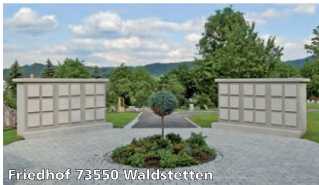
Friedhof 73550 Waldstetten