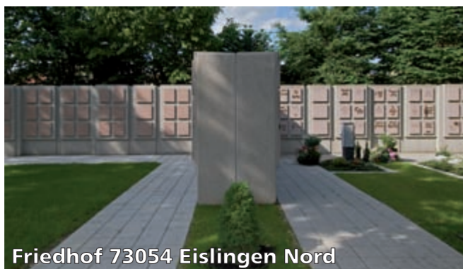
Friedhof 73054 Eislingen Nord