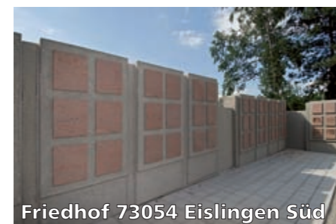
Friedhof 73054 Eislingen Süd