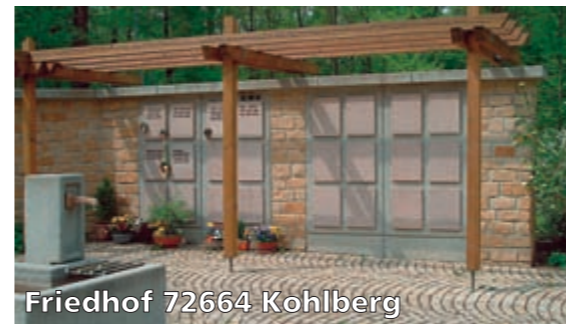
Friedhof 72664 Kohlberg