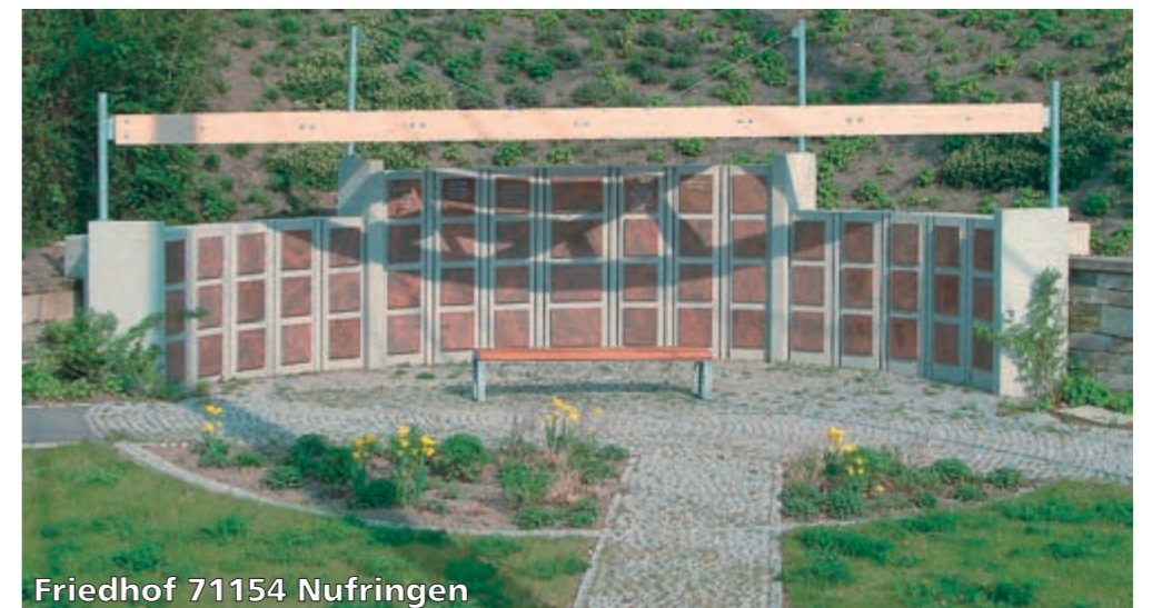
Friedhof 71154 Nufringen