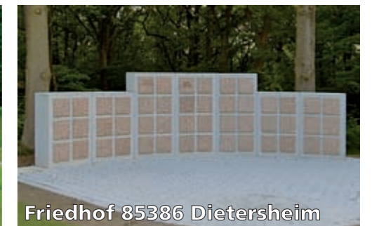
Friedhof 85386 Dietersheim