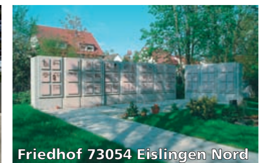
Friedhof 73054 Eislingen Nord