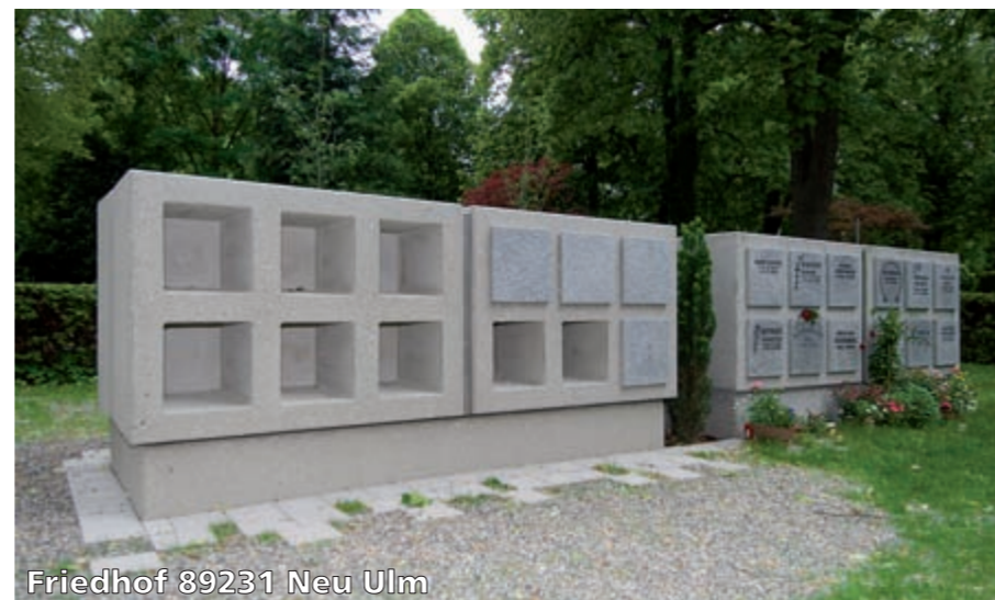
Friedhof 89231 Neu Ulm